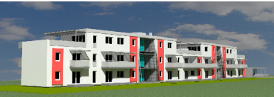
Johann-Koller-Weg 24b / Erdgeschoß